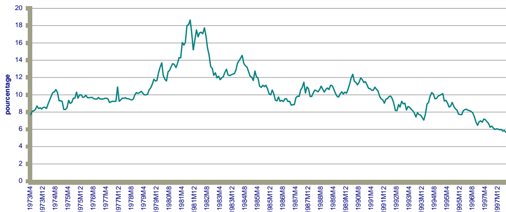
Figure 2 Évolution des rendements de l'obligation du Québec 10 ans

À première vue, il y a lieu de croire que les données sont non stationnaires. Pour le confirmer, nous allons effectuer le test statistique de racines unitaires de Dickey-Fuller. Ce test permet de vérifier le caractère aléatoire des données ; c'est-à-dire qu'il valide la stationnarité des données. Dans la mesure où les données seraient non stationnaires, l'utilisation des variations de rendement plutôt que des rendements eux-mêmes serait privilégiée.